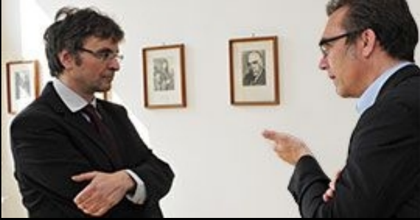
Beratung und Service