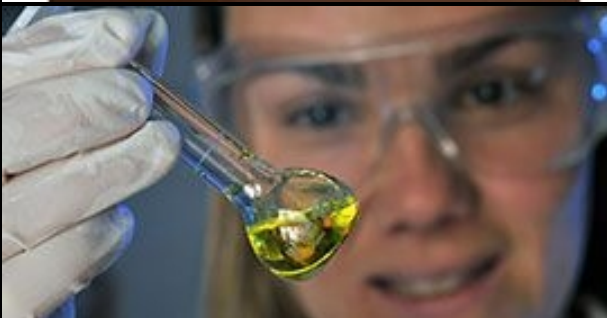
Gute wissenschaftliche Praxis